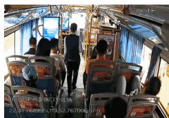
大型公共交通工具